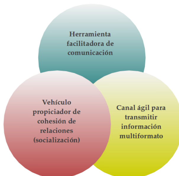
Figura 1. Categorías en las cuales se agrupan las posibilidades educativas delimitadas

A juicio de los futuros maestros, las redes pueden integrarse en las actividades escolares puesto que favorecen, en primer lugar, una ágil comunicación entre los alumnos y el profesorado (34%); también señalan que fomenta la motivación de los alumnos (22%); así como el intercambio de información fluida entre sus compañeros y profesores (12%); la posibilidad de compartir archivos multiformato (11%); propiciar la socialización entre el alumnado (9%); compatibilizar horarios (9%); y, un marginal 3% apelan a la oportunidad que las redes presentan para desarrollar debates síncronos, muchos lo relacionan especialmente con la inmediatez de Twitter .