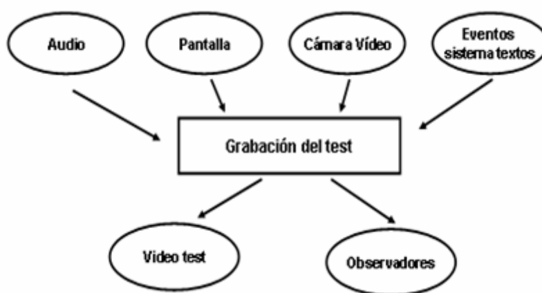
Figura 3. Modelo de funcionamiento de un test

permite sincronizar la captura del video del trabajo del estudiante con el video de sus expresiones y a su vez recoger un gran volumen de datos de navegación. Estos datos son el conjunto de los clics de ratón, los focos de pantalla y todas las acciones de teclado. En nuestro caso hemos usado únicamente el número de clic y los tiempos de consecución. Este software se instala en el ordenador donde el estudiante efectúa el test, junto con una webcam que permite seguir las expresiones faciales del estudiante. El resultado del test se grava o puede observarse en tiempo real desde uno o varios ordenadores conectados a la misma red que el ordenador de test.