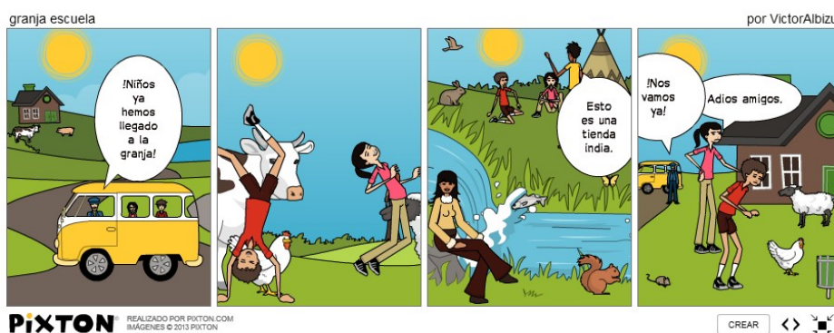
Figura 3. Historia 28 Víctor: «Granja escuela», su recuerdo de la escuela mediante un cómic con el programa Pixton .