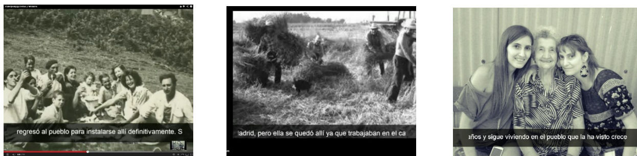
Figura 5. Historia 1 Alba M: «Gregoria», el relato de una vivencia educadora por la abuela http://www.youtube.com/watch?v=gLot_f4m78