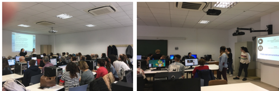
Figura 2. Aula avanzada y aula inicial.

cómo situar en una de las dos sesiones a cada persona mayor que venía. Para ello, cada estudiante se hizo “responsable” de una persona mayor según llegaba a la Facultad: recibirla, presentarse, explicarle cómo habíamos organizado las sesiones, acompañarles hasta la segunda planta donde están las dos aulas y situarla en una de ellas. Una vez constituidos los dos grupos, los estudiantes que habían realizado el material tenían que llevar a cabo la sesión de forma autónoma y con el apoyo del resto de estudiantes que interviniesen en esta sesión. En la Figura 2 podemos ver el desarrollo de la sesión.