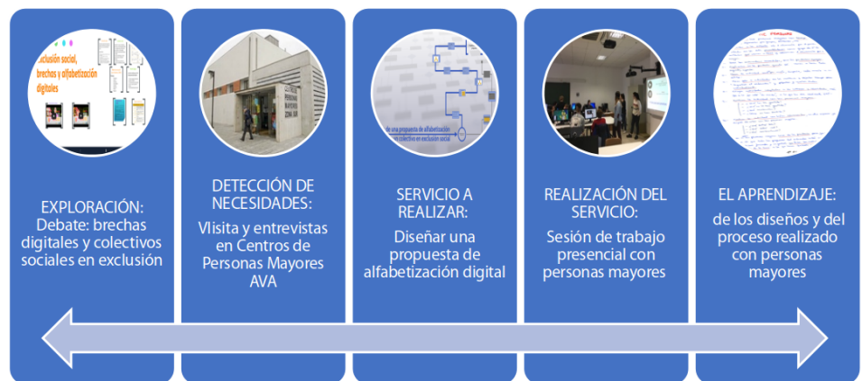
Figura 1. Proceso de ApS llevado a cabo.

personas mayores que asisten a diferentes actividades formativas sobre TIC en los Centros de Personas Mayores del Ayuntamiento de Valladolid y se continúa diseñando una propuesta educativa de alfabetización digital dirigida al colectivo. En la siguiente fase se realiza el servicio al colectivo, con una sesión presencial en las aulas universitarias con las personas mayores. Finalmente, se realiza un proceso de evaluación con las y los estudiantes donde intentamos abordar el conocimiento sobre los aprendizajes que ha realizado el alumnado con esta experiencia y metodología. Las iremos desgranando en de forma ordenada y cronológica para su mejor comprensión en el apartado de resultados.