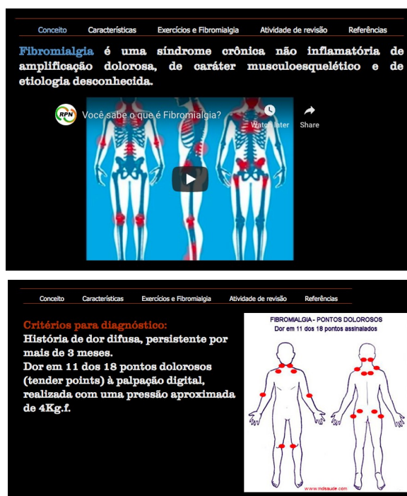
Figura 1. Capturas de tela do material autossuficiente de estudos elaborado na plataforma Wix.

O material autossuficiente de estudos foi criado na plataforma Wix e disponibilizado num grupo fechado da turma no Facebook, através de um guia de aula que continha todas as informações sobre a atividade e o link do material de estudo (Figura 1). O Wix 1 é uma plataforma que possibilita elaborar sites por meio da edição e incorporação de materiais multimídia (Abellan, 2015). Os materiais criados através desta plataforma podem ser considerados eficientes pela agilidade e tempo para sua construção (Costa et al., 2014). Segundo Ferreira, Corrêa e Torres (2013) o Facebook proporciona ao professor diferentes formas para incentivar e motivar o estudante no seu processo de ensino-aprendizagem. A Figura 1 apresenta capturas de tela que exemplificam o design do material elaborado na plataforma Wix.