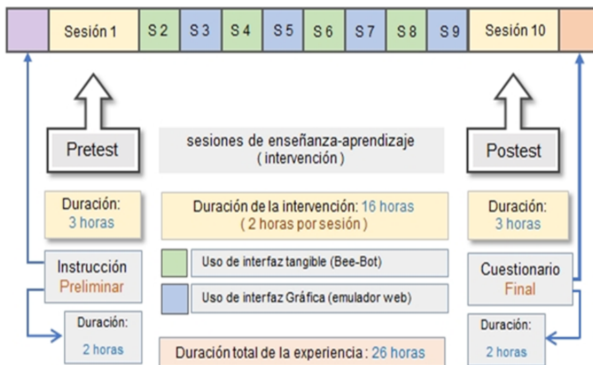
Figura 3. Distribución de sesiones en la experiencia de aprendizaje sobre PC. Elaboración propia

Las actividades organizadas se enfocaron a la resolución de problemas con retos o desafíos mediante la construcción de secuencias básicas y de complejidad media. La cantidad de movimientos requeridos, y el uso o no, de giros definió la complejidad de la secuencia (González y Muñoz-Repiso, 2017; González y Muñoz-Repiso, 2018). La experiencia desarrollada implicó un total de 26 horas (Figura 3).