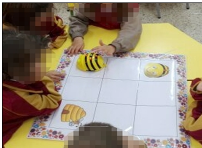
Figura 1. Kit de robótica Bee-Bot® y tapete utilizado en las actividades.

se querían alcanzar, para esto se estableció el tipo de secuencia: simple y de complejidad media.