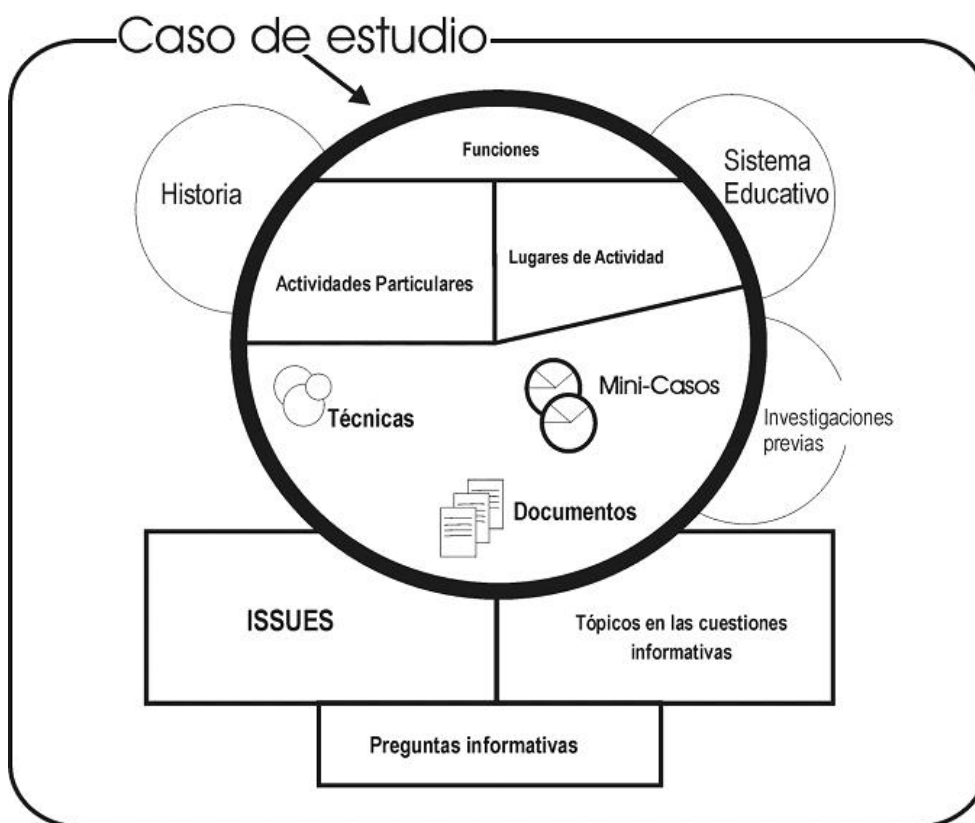
Figura 1. Esquema de análisis de los casos de estudio

En primer lugar, el contexto que es la base del primer acercamiento al mismo, así como lo que nos ayuda a definir las cuestiones para el análisis y los "issues" o temas de investigación/tensiones del caso. Tiene continuidad durante el proceso, puesto que es la forma de ir acercándonos al caso de estudio de manera comprensiva y cuanto más tiempo pasamos en contacto con una realidad, más se conoce. Posteriormente, nos encontramos los issues o temas de investigación, cuestiones éstas que surgen del conocimiento del caso y a partir de las preguntas que se hacen los investigadores, pero que pretende resaltar las tensiones o tópicos de éste, que nos permitirán su análisis profundo. Asociadas a estos, aparecen preguntas informativas para desgranarlo.