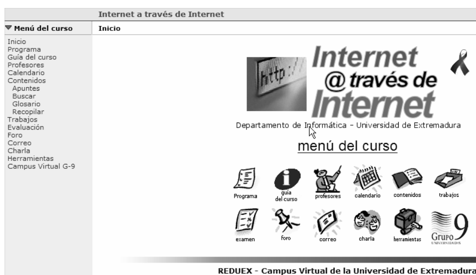
Figura 2. Menú principal de la asignatura en la plataforma WebCT