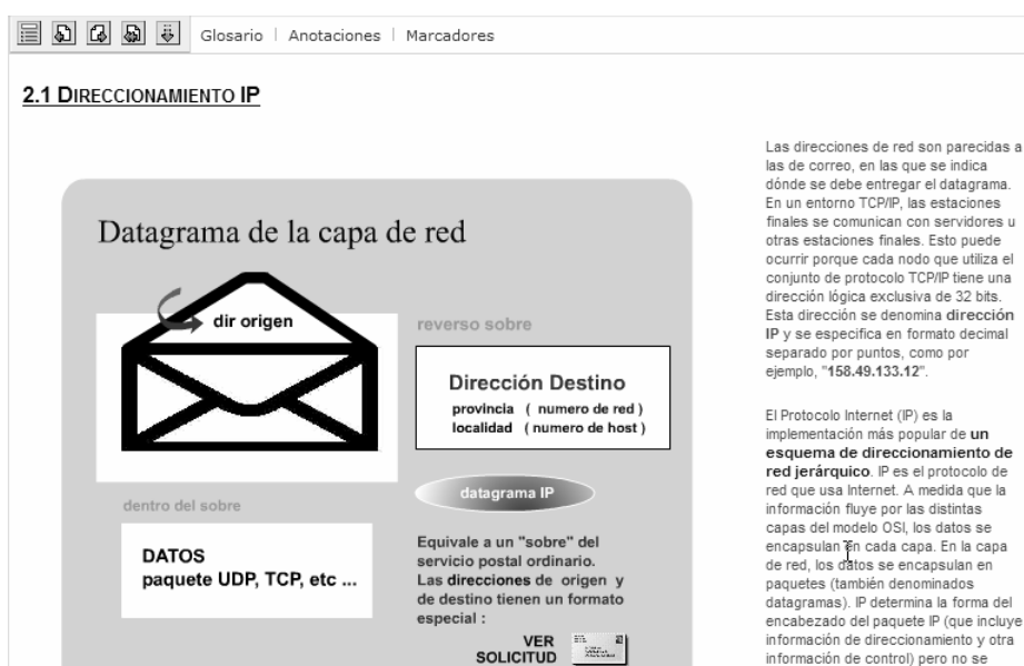
Figura 1. Ejemplo de contenido HTML con animación Flash